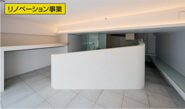
▲「リノベーション・オブ・ザ・イヤー2024」では、「時代を超えた賃貸『2001年宇宙の旅』」が「ミニマリズム・リノベーション賞」を受賞した