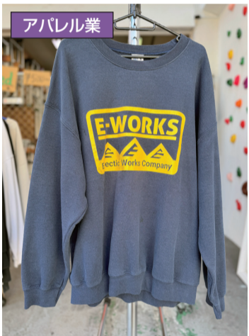
▲Tシャツやトレーナー、ワークウェア、キャップ、タオル、バック、キーホルダーなどさまざまなオリジナルグッズを展開している