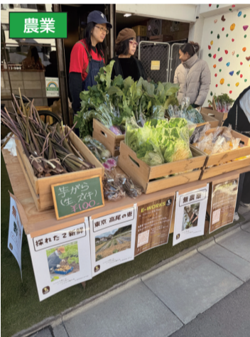
▲無農薬野菜の栽培・販売を行う。さまざまな旬の野菜や果物をリーズナブルな価格で提供している